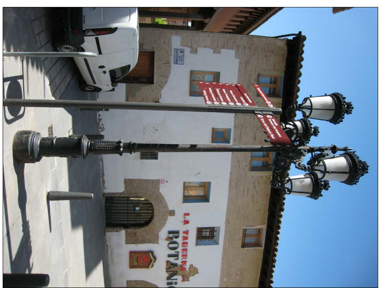
DETALLE FAROLA EXISTENTE